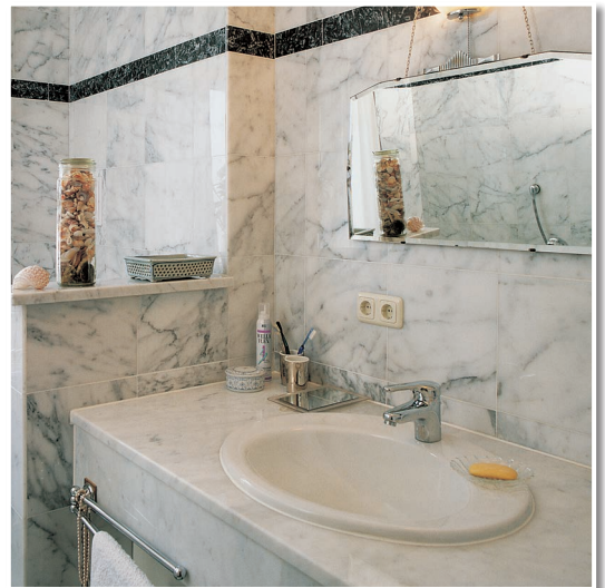
Das Marmorbad. Verlegt mit den LUGATO Produkten für Marmor und Granit.