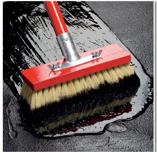
SCHWARZER BLOCKER VORANSTRICH satt auftragen vor der Dachreparatur.