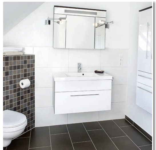
Das fertige Bad. Ausgefugt mit SICHERHEITSFUGE FLEXIBEL.

An Wand und Boden. Innen und außen, auch unter Wasser.