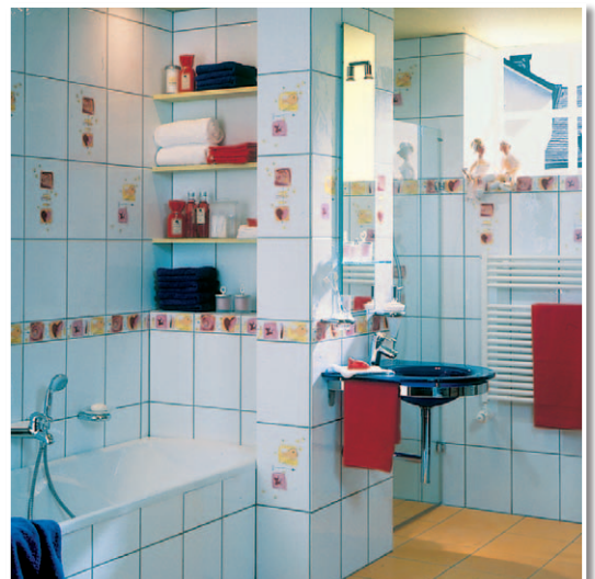
Für Dusche und Bad: das perfekte Abdichtungs- und Klebsystem von LUGATO.