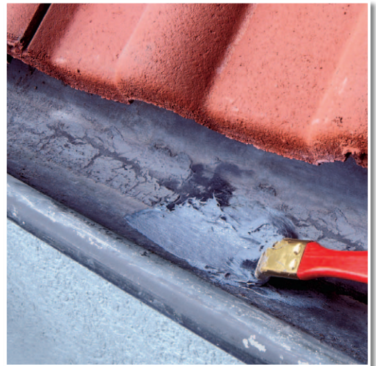
Reparatur einer Regenrinne mit SOFORT DICHT!.