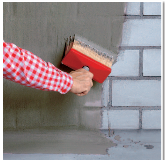
Abdichten mit TROCK'NER KELLER DICHUNGSSCHLÄMME, hier auf Kalksandsteinmauerwerk.