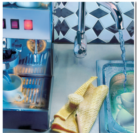
Elastischer Fugenverschluss in einer Pantry.