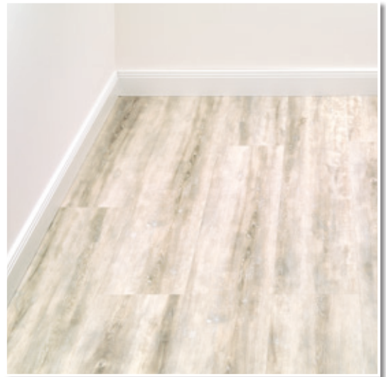
Moderne Designbeläge einfach selbst verlegen.