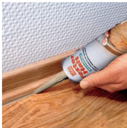
FESTER HALT: im Farbton passend zur Sockelleiste.