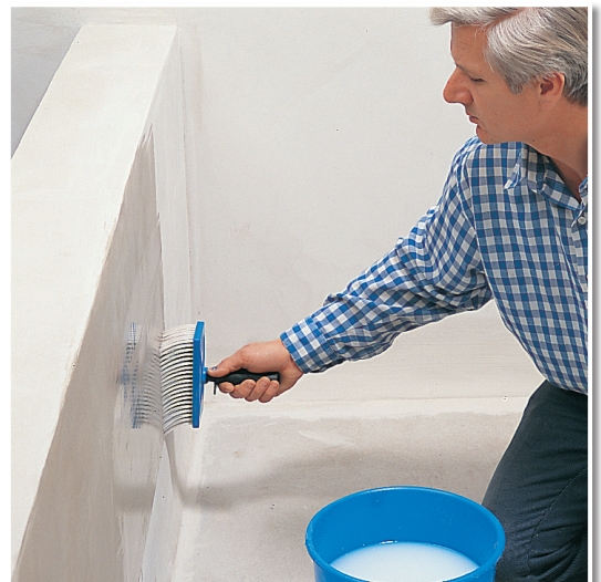
Grundieren eines saugfähigen Putzes vor Folgearbeiten, z. B. Anstreichen.