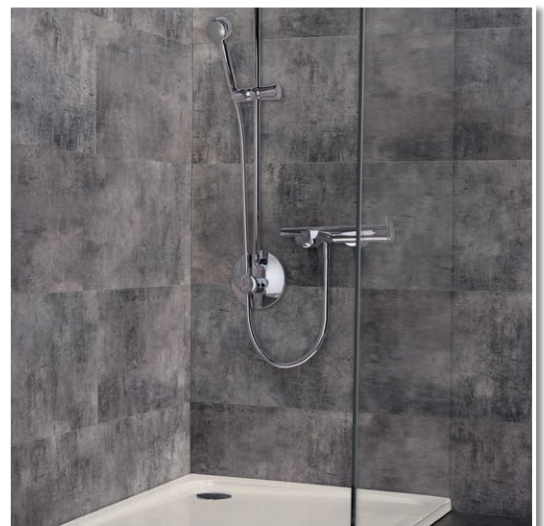
Höchste Klebkraft auch in der Dusche.

Boden- und Wandflächen, im Innenbereich.