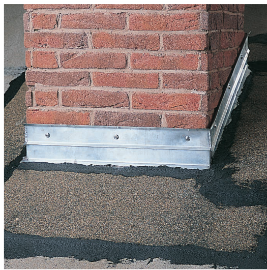
Kappeleiste am Schornstein mit SCHWARZER BLOCKER SPACHELMASSE und Bitumenbahn abgedichtet.