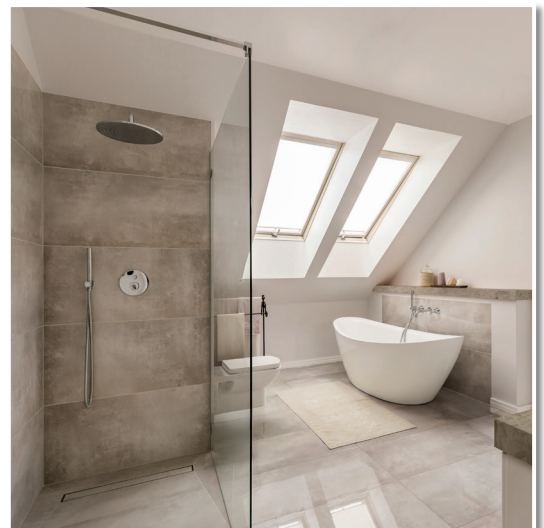
Versiegelung für langlebige und schöne Fugen.