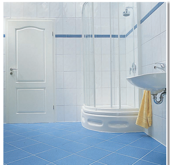
Die fertige Dusche. Eck- und Anschlussfugen elastisch abgedichtet.