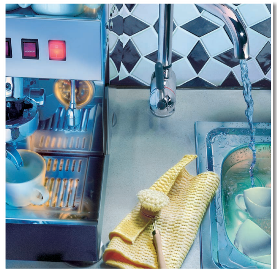
Elastischer Fugenverschluss in einer Pantry.