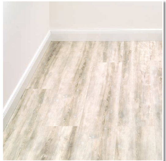
Moderne Designbeläge einfach selbst verlegen.