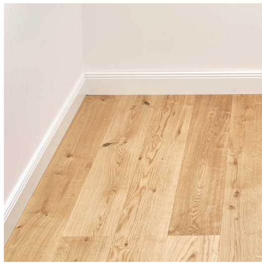
Raum mit Holzparkett und Hamburger Leiste.