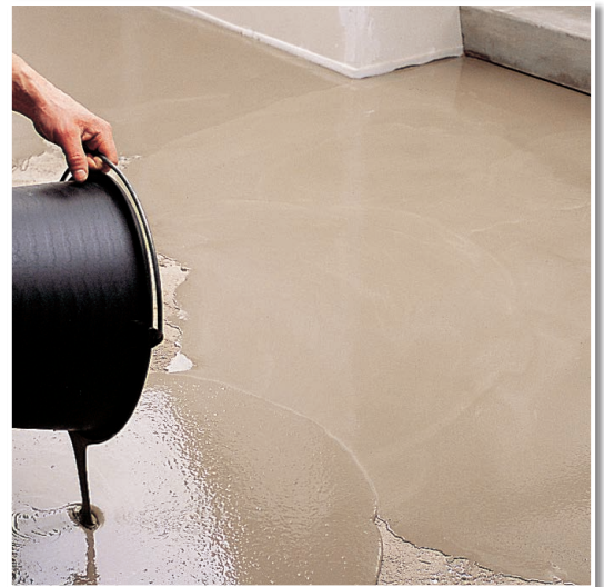
Verläuft von selbst zu planebenen Oberflächen.