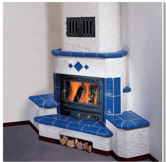
Kaminofen. Schamottesteine mit FEUERFESTMÖRTEL gemauert.