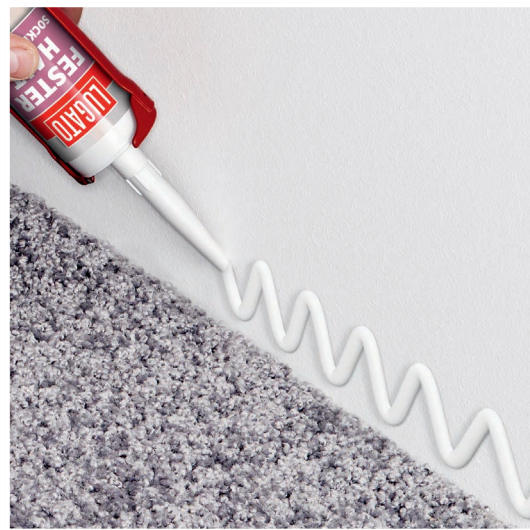
FESTER HALT ist lösemittelfrei und klebstark.