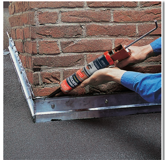
Abdichten einer Kappeleiste am Schornstein mit SCHWARZER BLOCKER DICHTMASSE.