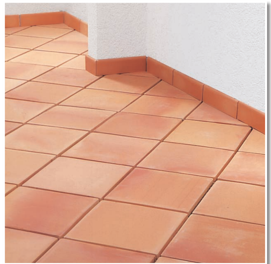
Cotto-Belag nach dem Verfugen mit SAUBERE SACHE abgesäuert.