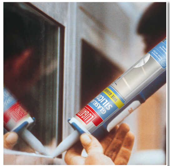
Fensterfalzversiegelung zwischen Glas und Aluminiumrahmen.