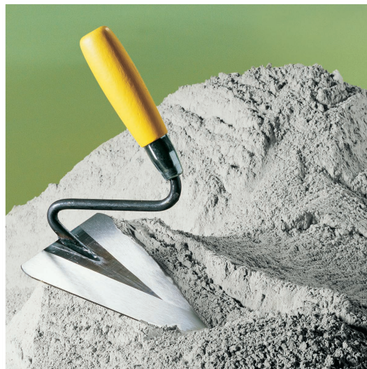
Weißer Portlandzement für das individuelle Bauen.

Zum Selbstanmischen von verschiedenen Mörtelarten, z. B. Reparaturmörtel, Fugenmörtel, Putzmörtel.