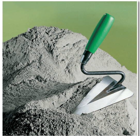
Grauer Portlandzement für das individuelle Bauen.

Zum Selbstanmischen von verschiedenen Mörtelarten, z. B. Verlegemörtel, Putzmörtel, Reparaturmörtel.